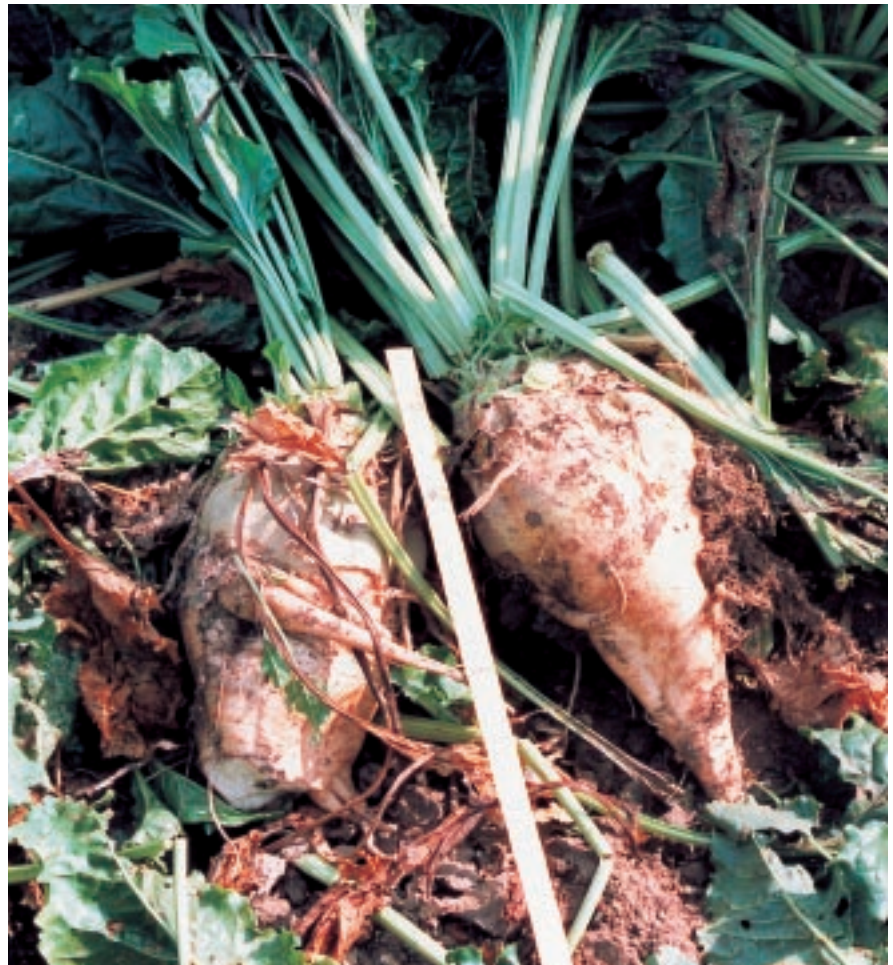
Zuckerrüben, Biotechnologie per Agricoltura

Der Einsatz von Mineraldünger ist heutzutage durch den Intensivanbau und die Auswahl landwirtschaftlicher Hochleistungsnutzpflanzen notwendig, um den erhöhten Nährstoffbedarf der Pflanzen zu kompensieren, darf aber nur als Ergänzung des organischen Basisdüngers verwendet werden, so wie es das System des biologischen Bodenverbesserungsmittels von Biotechnologie per Agricoltura vorschreibt. Das biologische Bodenverbesserungsmittel hat folgende Vorteile: Verbesserung des ökologischen Gleichgewichts, Produktion von Lebensmitteln mit verbesserten Nährstoffen und organoleptischen Merkmalen (Geruch, Farbe, Geschmack, Haltbarkeit),