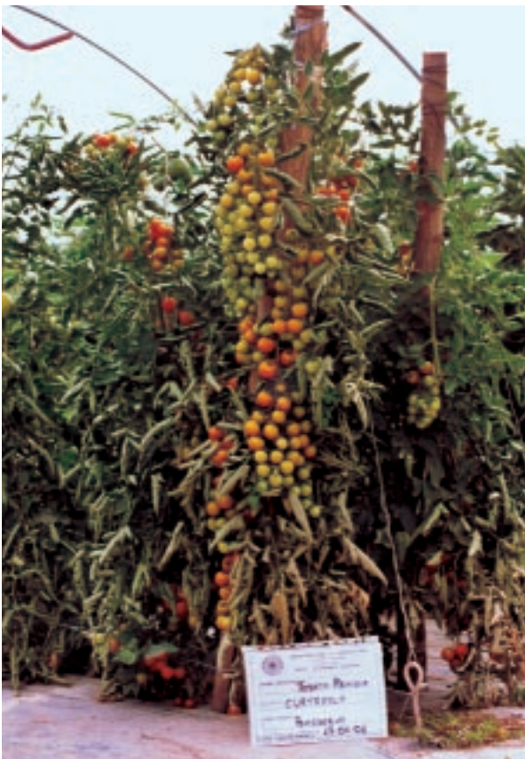
Staudentomaten, Biotechnologie per Agricoltura

italienischen Verband zur Entwicklung der Biotechnologien, und stellen Ihnen die Forschungsaktivitäten und Produkte von ausgewählten Instituten und Unternehmen der italienischen Biotechnologieszene vor.