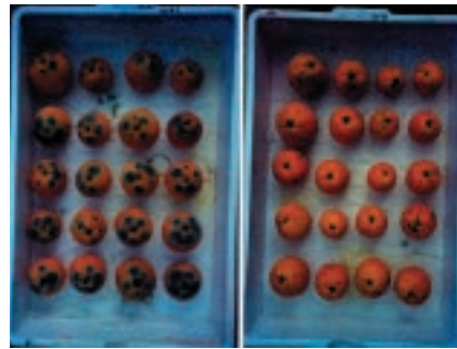
Zitrusfrüchte, ISPA – CNR, Bari

Forscher des neu gegründeten Instituts für Nahrungsmittelwissenschaften ( Istituto di scienze delle produzioni alimentari - ISPA ) in Bari haben zwei neue Methoden entwickelt um Mykotoxine in Mais, Bier und Wein durch Analysen erkennen zu können: „Immunoaffinitätsäulen“ für die Reinigung der Extrakte, die spezifische Antikörper für das zu analysierende Toxin enthalten und die Qualität deutlich verbessern und eine sehr zuverlässige Analyse liefern. Die Mykotoxine sind toxische Metaboliten, die von mikroskopischen Pilzen produziert werden. Das Problem dieser Mikroorganismen und der dazugehörigen Toxine wird dadurch erhöht, dass diese möglicherweise in biologischen Produkten enthalten sind, die viel konsumiert werden, wie z. B. Getreide, Gemüse, Trockenfrüchte, Kaffee, Wein und Bier.