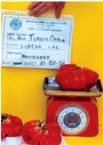
Tomaten, Biotechnologie per Agricoltura

höherer Widerstand der Kulturen gegen Temperaturschwankungen, stärkere Resistenz gegen Toxine, Infektionen und Parasiten, Wiederherstellung von eingestellten biologischen Prozessen und vegetative Erholung der inaktiven Pflanzen, nahezu Spitzenresultate beim Aufgehen der Saaten und konstante Produktion während der ganzen Zeit. Der Dünger wird mit natürlichen Humusstoffen in Hahnenmannscher Form hergestellt, ist frei von Pestiziden, Schwermetallen, Phytostimulanzien und Hormonen und soll folgendes erreichen: