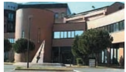
CBA – Eingang, CBA Genua

Start-ups. Die Begegnung ist für beide von Vorteil: Die Forscher sehen, wie ihre Entdeckungen realisiert werden, und die Unternehmen investieren wiederum in die technologische Entwicklung und produzieren außerhalb des Zentrums. Insofern fungiert das CBA als Entwicklungsort für biologische Prototypen. Innerhalb des CBA wurde außerdem ein Konsortium der fünfzehn wichtigsten italienischen Pharmaunternehmen gegründet.